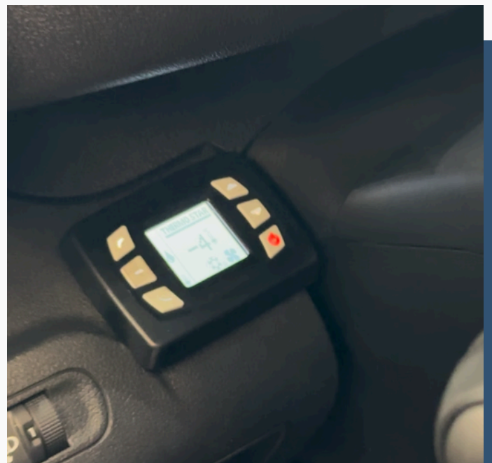
Controlador Digital Slim